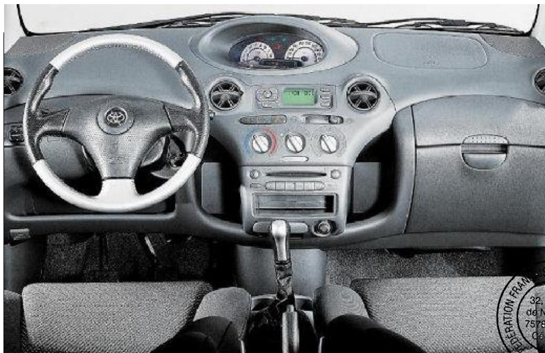
Tableau de bord d'origine de la voiture de série