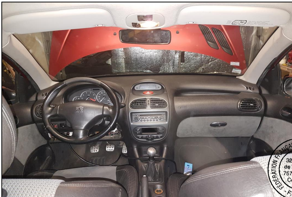
Tableau de bord d'origine de la voiture de série

Traverse avant supérieure d'origine de la voiture de série